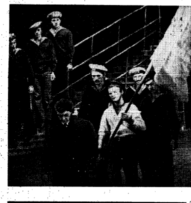
НОВАЯ МОСКВА. В Театре имени Евг. Вахтангова...